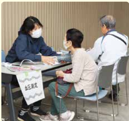
血圧測定コーナーで血圧を測る来場者

会場には、血圧測定コーナーや簡単な脳トレ体操、服薬や介護などに関する相談ブースなどが並び、訪れた人たちは担当者や会話を交わしながら和やかに過ごしていました。また、JA職員はそろいの法被を着て参加し、JAバンクの仕組みやサービスを紹介しました。