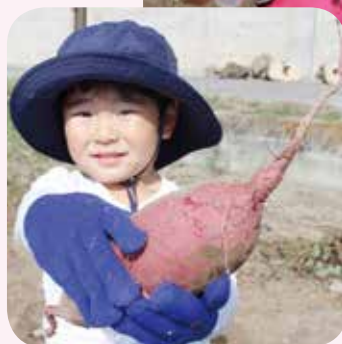
まるまる太ったおイモだよ