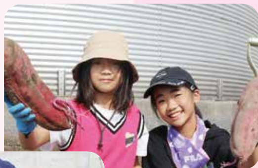
私たちが掘り出しました