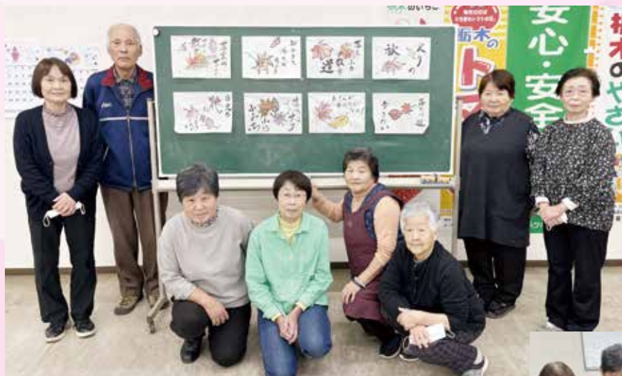
活動スタートを記念してみんなで記念撮影