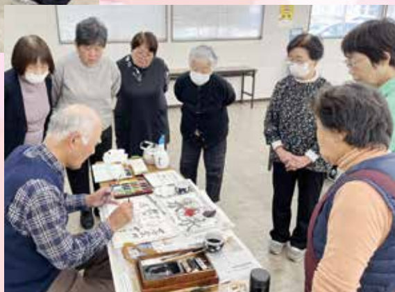
先生のお手本に見入る会員 筆運びの技量に魅了されます