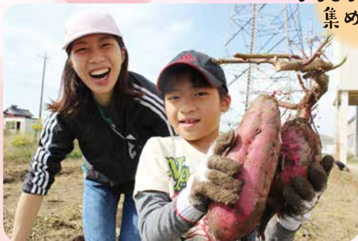
思いもかけない大きなサツマイモに驚きと感動