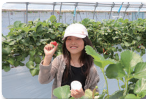
おいしそうなイチゴ見つけたよ