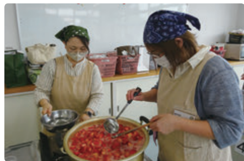
鍋でイチゴジャムを煮詰める会員ら

JAしもつけのフレッシュミズ「菜の花会」は5月8日、栃木地区の大宮公民館でイチゴのジャムづくりを行いました。毎年会員から好評を得ている人気企画。会員9人が参加し、今回も会員同士親睦を深めながら、楽しくジャムづくりに励みました。なお、JA共済「地域貢献活動」の助成を受けて実施しました。