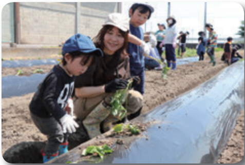
上手に植えられたね