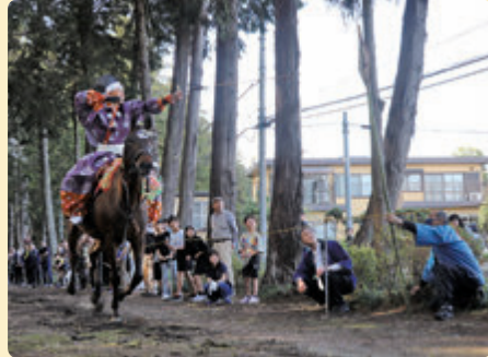
的に狙いをさだめて弓を引く射手