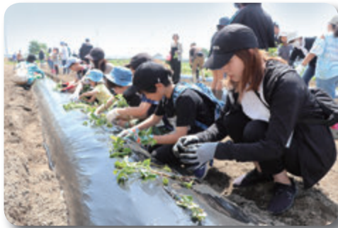
みんなそろって楽しく作業