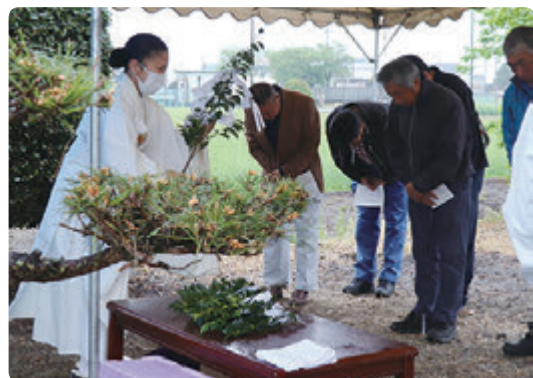
神事に臨む参加者

家畜の御霊を供養するため、JAしもつけ肉牛部会は4月24日、栃木地区の藤田倉庫で第9回獣魂慰霊祭を開きました。部会員、JA職員ら22人が出席。同倉庫敷地内に建つ獣魂慰霊碑前に祭壇を設け、神職が神事を執り行い、参加者全員が玉串を供えました。