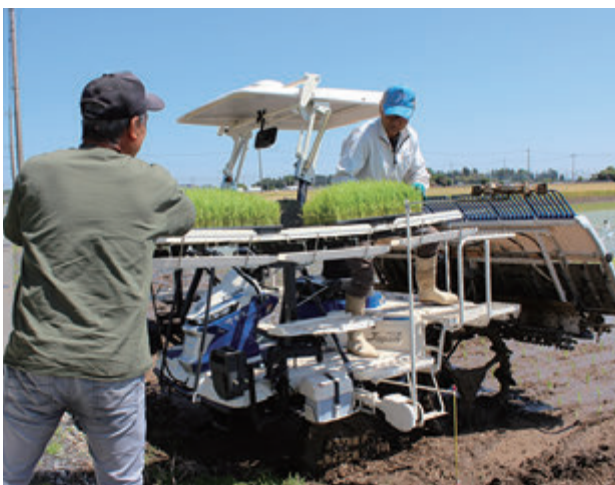
田植の作業に励むグリーンファームしもつけの社員

今後、同社による田植作業は、60haの麦収穫作業をはさみ、6月下旬ごろまで続く見込みです。