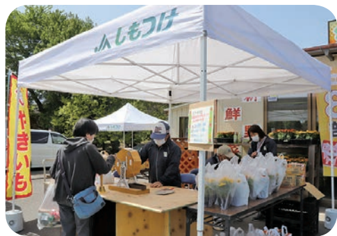
抽選会を楽しむ来訪者

JAしもつけの「みぶ農産物直売所『いなばの郷』」は4月22日、オープン20周年を記念して「春の感謝祭」イベントを開催しました。町内外から多くの買い物が訪れました。 同直売所は、2003年4月にオープン。壬生菜やゴボウなどをはじめとする地元の特産品を豊富に取りそろえています。 同直売所では、毎年この時期に合わせて、同様の売り出しイベントを開催してきました。今年は、オープン20周年の記念として、来店客すべてに20周年記念の名入りボールペンや花苗を配布しました。また、買い物金額1,000円以上で、1回参加できる抽選会も行いました。買い物客は、レシートを手に1等の地元産コシヒカリ5kgや2等地元産トマト、3等地元産たまごの景品を目指して抽選を楽しんでいました。