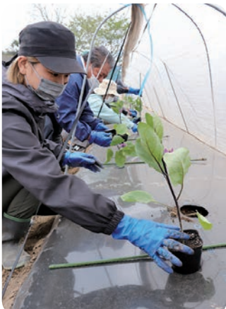
定植の実技に臨む新規栽培者

JAしもつけナス部会は4月18日都賀地区で第1回夏秋ナス新規栽培者講習会を開きました。今後の予定者を含む新規栽培者、部会役員、JA職員ら13人が参加し、ナス栽培に関する基礎的な知識を学びました。 同部会では、新規栽培者の育成と安全・安心で高品質なナス生産を目的に、13年前から同様の講習を行っています。 7月までに年間3回の講座を予定しており、時期ごとに必要となる作業や栽培管理の手順、ポイントを身に着けます。初回となる今回は、今後5月の上旬を目安に定植時期を迎えることにちなみ①食の安全・安心に向けた取り組み②定植の手順③今後の栽培管理について学びました。 参加者は、講師の説明を熱心に聞き、不明点などについて積極的に質問しました。