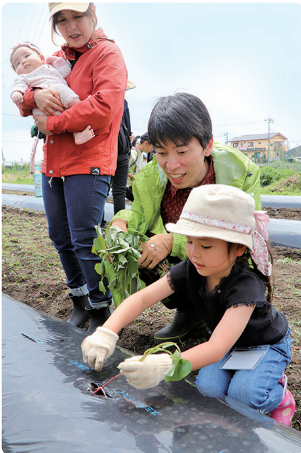
サツマイモ苗の定植体験を楽しむ参加者親子

食農体験講座「あぐり親子うきうきクラブ」2023年活動がスタートしました。事前に参加登録した管内栃木市・壬生町在住の親子24組66人が参加。初回となる今回は、開講式を兼ねて、サツマイモ苗の定植体験とイチゴの収穫体験を行い、食や農業について楽しく学びました。