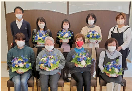
4月9日フラワーアレンジメント体験教室

JAしもつけ葬祭センターでは、友引の日を利用し、今後もこのような体験教室やミニイベントを定期的に行い、会員様や地域の方々と交流を図っていきたいと考えております。