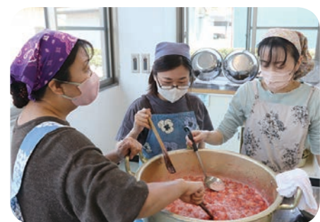
鍋でイチゴを煮詰める会員ら

JAしもつけのフレッシュミズ「菜の花会」は5月11日、栃木市大宮公民館で4年ぶりとなるイチゴのジャムづくりを行いました。会員9人が参加。感染症対策に十分注意しながら、会員同士楽しい時間を過ごしました。なお、JA共済「地域貢献活動」の助成を活用して実施しました。 毎年、イチゴの収穫が終わりに近づく時期の恒例行事でしたが、コロナ禍で2020年は中止。2021年、2022年は会場に集まらず、会員にジャムの材料とレシピを配り、自宅でジャム作りを楽しめるようにしました。 今回用意したイチゴは、栃木市産の「とちおとめ」45kg。会員らは、イチゴに砂糖を入れて軽く潰したものを強火で煮ました。アクを取りながら1時間ほど煮詰め、仕上げにクエン酸を加え、滑らかな口当たり仕上げました。出来上がったジャムは、昼食を兼ねてパンに塗って試食しました。