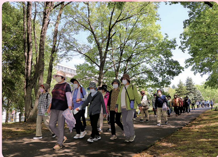
公園内を散策する会員ら

会員らは、初夏の青空の下、鮮やかな新緑に色付いた木々や様々な種類の花を愛でながら、園内を巡り、ゴール後は、弁当と参加記念品を受け取り解散となりました。