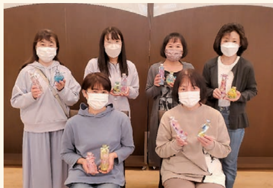
4月15日ハーバリウム体験教室