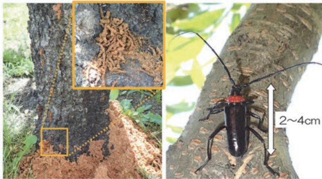
左：幼虫が排出し、株元に堆積したフラス（木くずと糞のまじったもの）。フラスは挽き肉状。 右：クビアカツヤカミキリ成虫