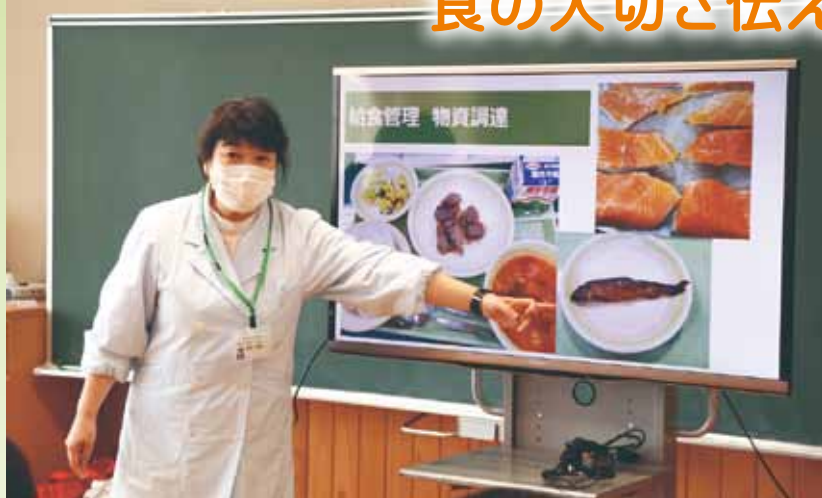
栃木市内の学校給食施設や教育委員会勤務を経て、昨年4月に現職。昨年から学校給食に地元大平産の枝豆を使った献立を取り入れて、子どもたちからも大変好評を得ています。

栄養教諭とは、2005年から始まった資格制度で、小・中学校で児童・生徒に食育の指導や学校給食の管理・運営に携わります。