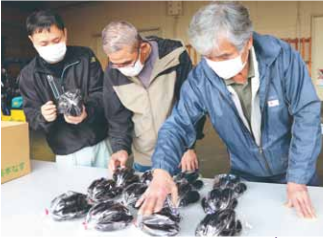
ナスの品質を確認する生産者とJA職員