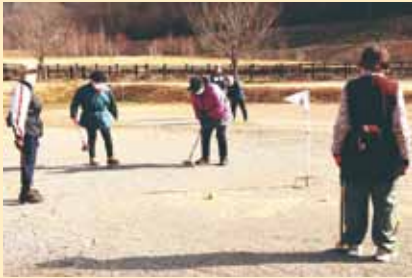
練習に励むメンバーたち

このコーナーでは、地域で活躍する皆さんの紹介や大好評「クイズコーナー」、広報誌の編集担当者がチラッと語らせてもらう編集後記をお送りいたします。