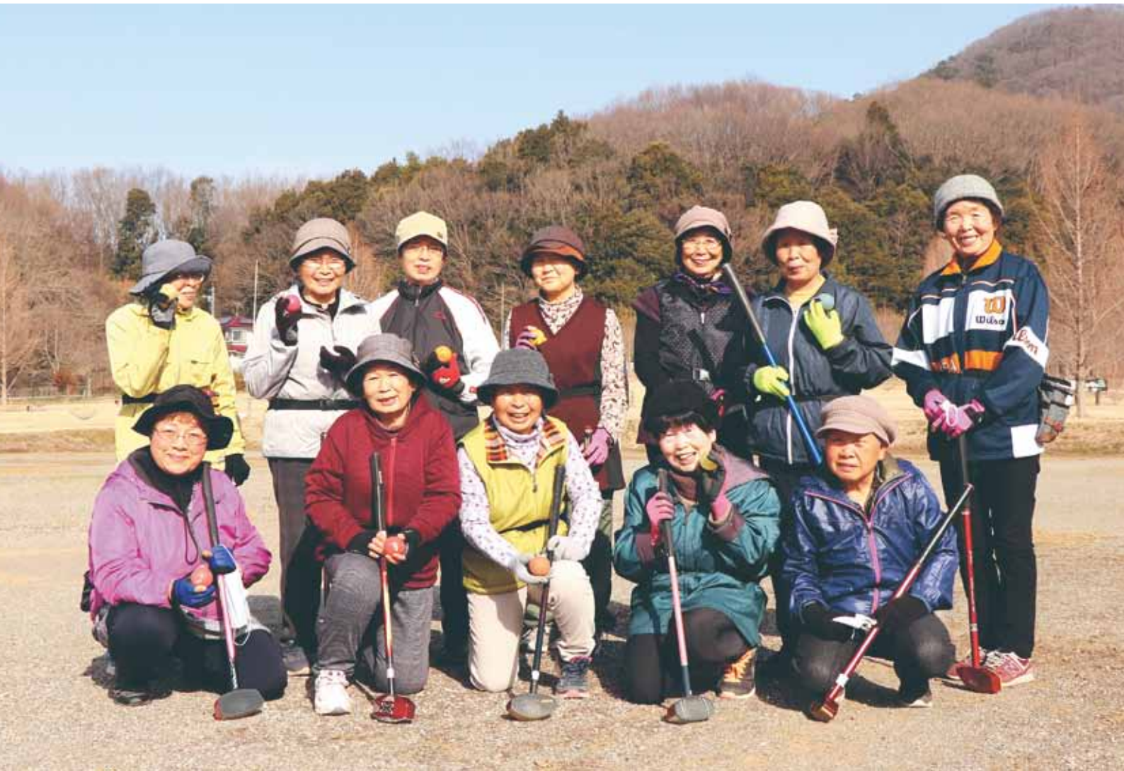
JALしもつけ岩舟地区女性会グラウンドゴルフクラブの皆さん