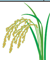
○米利用料金表（単位：円、kg）