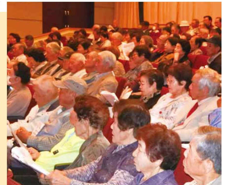
多くの会員が参加し、ホールは満員に!