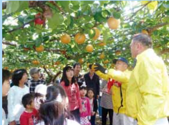
参加親子に収穫方法を説明する生産者

このコーナーでは、地域で活躍する皆さんの紹介や大好評「クイズコーナー」、広報誌の編集担当者がチラッと語らせてもらう編集後記をお送りいたします。