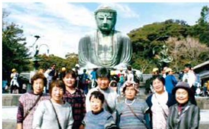
鎌倉大仏の前でパシャリ!!