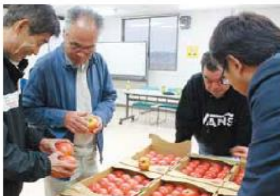
現物を確認する生産者

栃木トマト部会は11月9日、栃木地区営農経済センターで平成31年産トマトの目ぞろえ会を開きました。当日出荷されたトマトからサンプルを抽出し、形状や色などの規格を確認しました。 市場関係者が販売情勢を報告後、担当職員が出荷規格や選果選別の注意を説明。「出荷時のカラーチャートを厳守し、箱内のトマトの色目を統一してほしい」と強調しました。