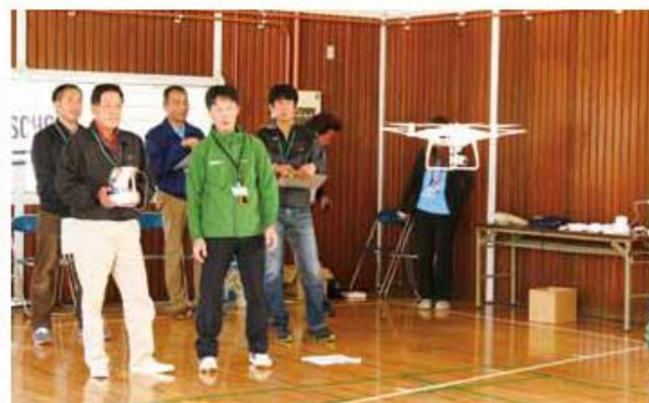
実技実習に臨む受講者

壬生自動車学校は、ドローンの実技講習「とちぎドローンスクール」を9月から開催しています。近年、空撮以外に測量や設計、農業散布、災害時の情報収集など様々な用途で利用されているドローンに対し「陸の交通安全を担ってきた自動車学校として、空の交通安全のためにも教育に取り組み」とし、安全安心なドローン操縦者の育成に力を注ぎます。 講習は月に4回、座学やドローンを使った実習、実技や筆記の試験を受け、合格者には証明書が発行されます。