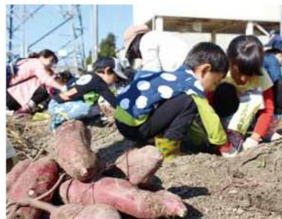
たくさんのイモを掘り起こしました