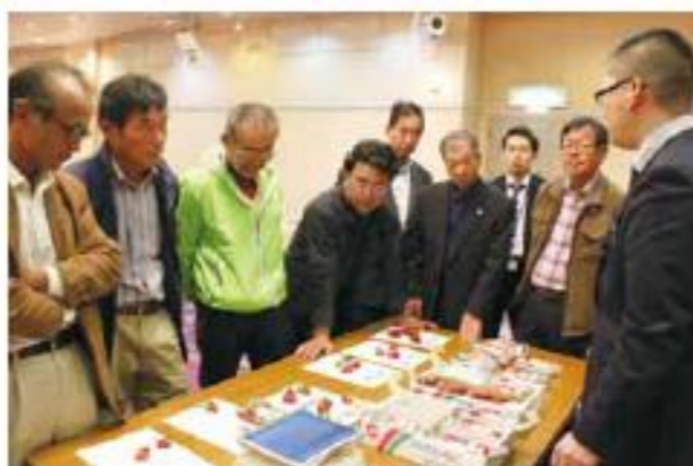
現物を確認する生産者

イチゴ「とちおとめ」の本格出荷を前に、JAしもつけイチゴ生産者組織連絡協議会は11月5日、アプロニーで統一目ぞろえ会を開きました。協議会の役員や市場関係者、検査員、JA職員ら約50人が参加。産地情勢や販売方針を確認し、現物を手に出荷規格を統一しました。 今年度のイチゴは、8月の高温、干ばつの影響が懸念されましたが、定植後の生育は順調。病害虫の発生も少なく、10月17日に初出荷を迎えました。カラーチャートや規格の徹底、早朝収穫の励行により出荷期間を通して高品質なイチゴの出荷を目指します。