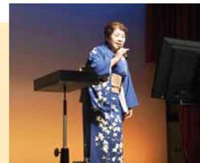
歌謡ショーやカラオケ教室を実施