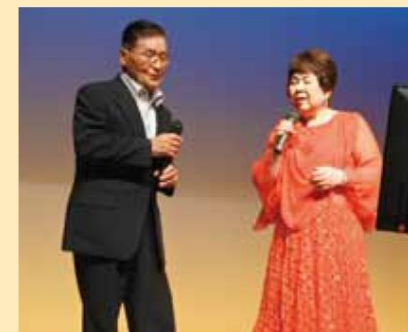
デュエットも楽しめました♪