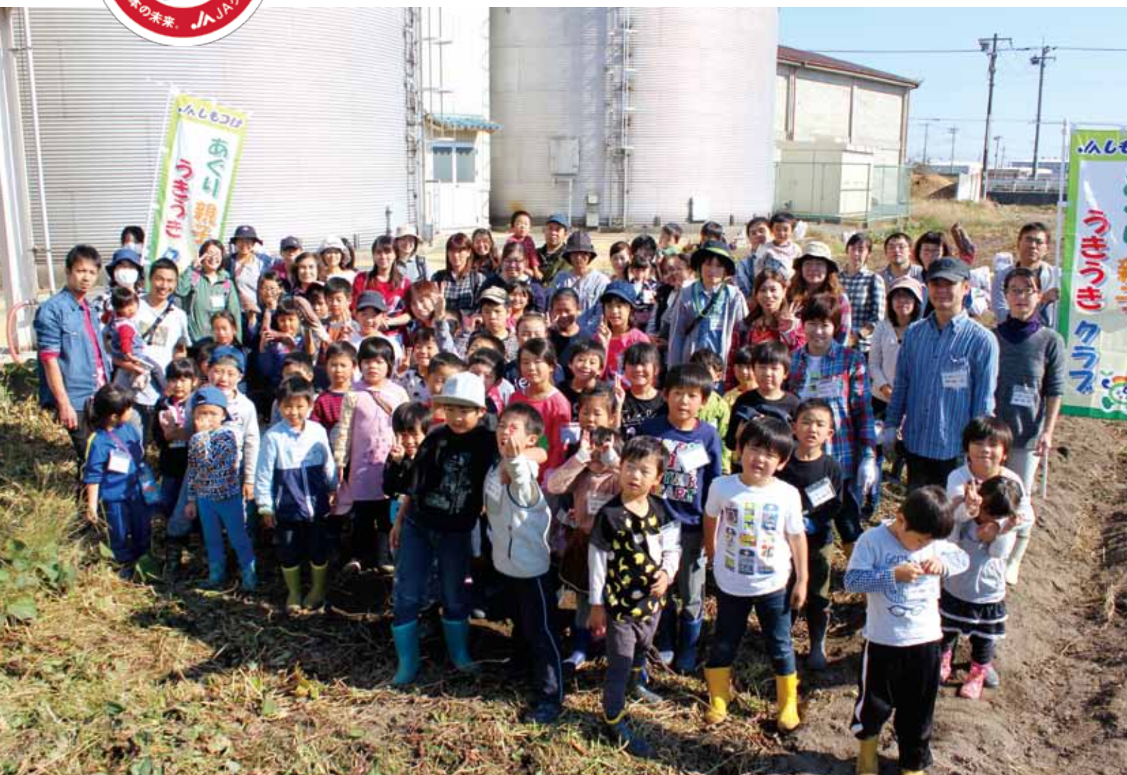
サトイモ・サツマイモ たくさん収穫したよ！ (あぐり親子うきうきクラブ 第3回活動にて)