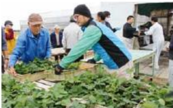
苗を積み込む生産者

JAは、生産者が高品質なイチゴを安心して生産できるように健全な親株の増殖に取り組んでいます。11月13日から16日にかけて、無病増殖基地で生産した平成32年産用イチゴ苗を生産者へ配布しました。 イチゴは、親株を更新しないとウイルス病に感染するリスクが高まるといわれています。ウイルス病に感染すると果形の奇形や収量の低下につながるため、JAでは健全な親株の生産が苗づくりの基本と位置づけ、13年前から無病苗の生産に取り組んでいます。 今回は「とちおとめ」スカイベリを約7万4000本配布しました。