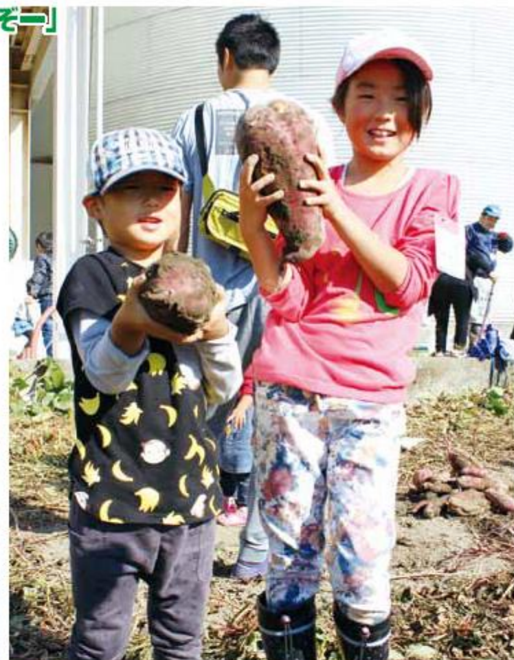
こんなに大きいイモは初めて!

JAしもつけは11月3日、「あぐり親子うきうきクラブ」の第3回講座を開きました。親子32組90人が、5月上旬に植えたサツマイモとサトイモの収穫作業を体験。どの親子も泥だらけになりながらイモを掘り起こしました。 子どもたちは、自分の顔ほどある大きなサツマイモを掘り起こすと「こんなに大きいイモが取れた」と重そうに持ち上げました。 収穫を終えた参加者は「どんな料理にするか、これから楽しみ」と笑顔を見せました。