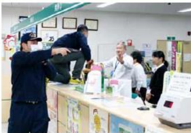
拳銃を突き付けて現金を要求する強盗役

JA本店・各支店では、店舗強盗や近年被害が増加している特殊詐欺に備え、防犯訓練を実施しています。 10月18日、栃木地区3支店合同で防犯訓練を実施。犯人に扮した警察官2人が拳銃を持って侵入、窓口担当職員を脅し現金を強奪する想定。他、「オレオレ詐欺」のような特殊詐欺の被害者が現金を引き出そうと窓口を訪れる想定で訓練を行いました。 強盗や詐欺にはさまざまなケースがあります。今後も事件の未然防止や発生時の対応に向けて柔軟な窓口対応を心掛けてまいります。