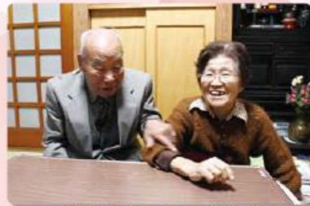
取材中も仲の良さが伝わってきました♪

「川柳作りは頭の体操にもいい。気ままに言いたいことを伝えるように川柳は続けていく」と、今日も作品を手帳に記します。