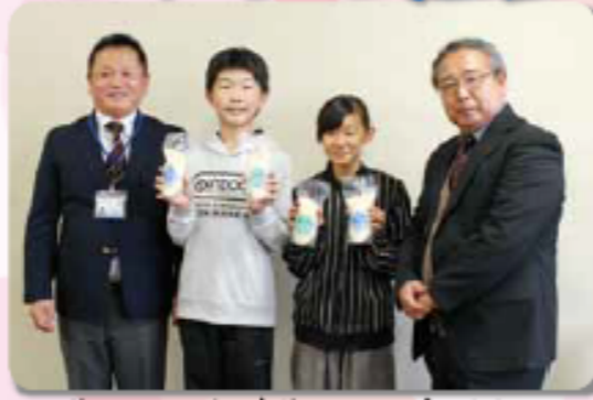
炊きたてのお米を家族でおいしく食べます!!

お米を受け取った代表生徒は「農家さんが大切に育ててくれたお米を家族とおいしく食べたい」と笑顔で話しました。