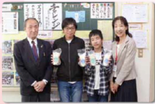
お米大好き!!たくさん食べます。