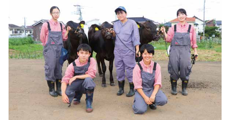
栃木農業高校 動物科学科の生徒

県立栃木農業高校は、栃木市にある県内唯一の農業単科高校です。 今大会から新設された「高校及び農業大学校」の部に出場。全国から 25頭が出場する中、大会本番までに積み重ねてきた準備の成果を 遺憾なく発揮しました。惜しくも入賞は逃したものの、若い力で栃木 県の和牛の魅力をしっかりとアピールしました。