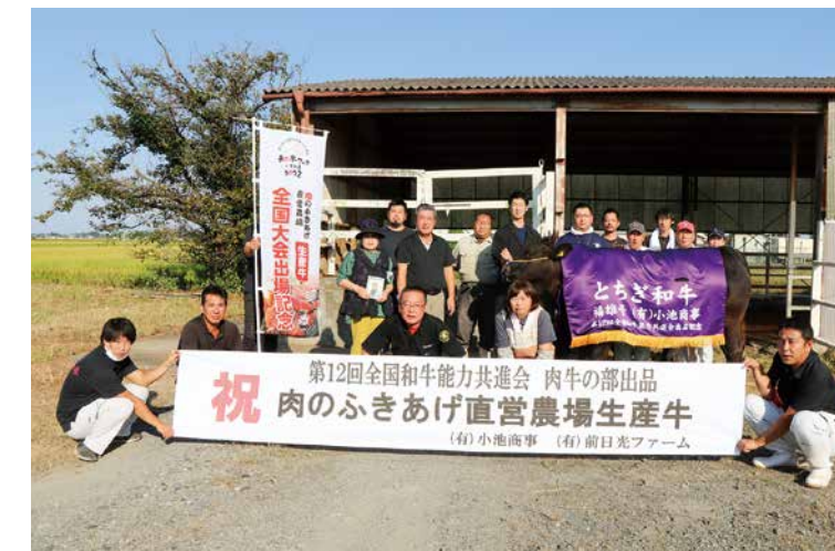
JAしもつけ肉牛部会の関係者の皆さん

8区（去勢肥育牛の部）では、全国から58頭が出場する中、見事 優等賞9席入賞という結果に輝きました。