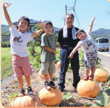
収穫を迎えたカボチャとお孫さんとともに

このコーナーでは、地域で活躍する皆さんの紹介や大好評「クイズコーナー」、広報誌の編集担当者がチラッと語らせてもらう編集後記をお送りいたします。