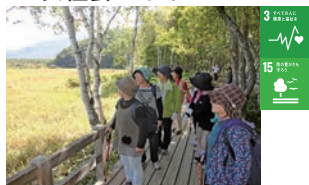
女性会ハイキング