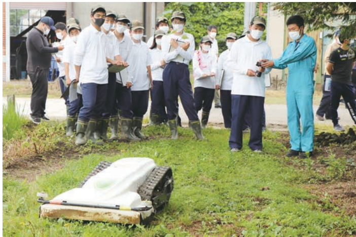
スマート農機を体験する栃木農業高校の生徒

下都賀農業振興事務所主催 「アグリマネジメントセミナー及び ニューファーマーカレッジ」