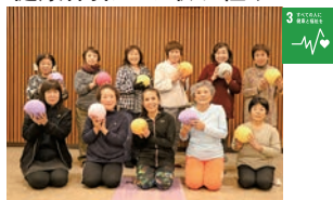
健康体操への取り組み