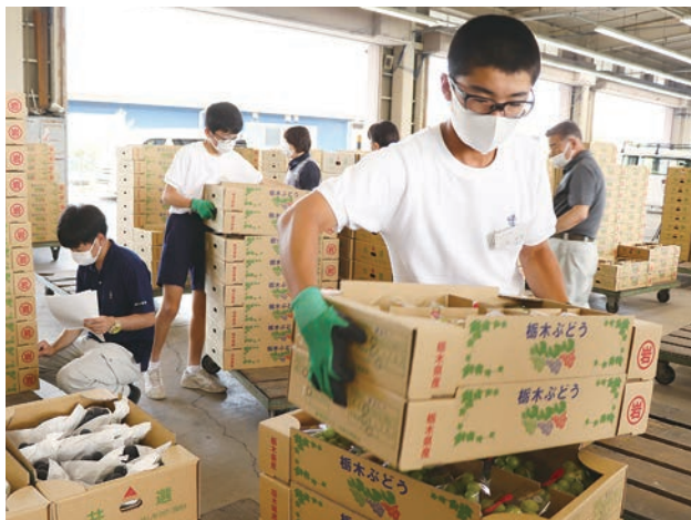
ブドウの集荷作業を体験する生徒

岩舟中学校の2年生生徒2人が6月28日から30日にかけての3日間、岩舟地区営農経済センターで、職場体験に臨みました。青果物の荷受けや購買店舗での手伝いを通じて、JAの業務を体験しました。