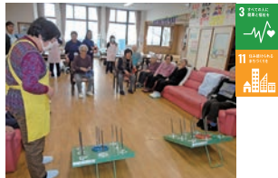
ひまわり会の高齢者 ボランティア活動