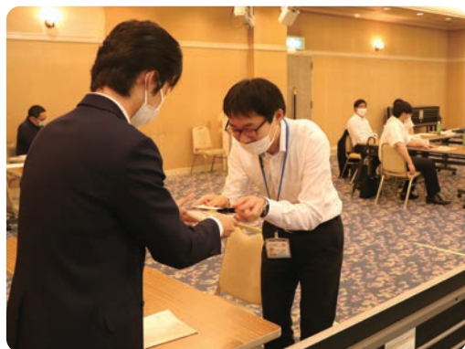
訪問先での名刺交換手順を確認する新入職員

7月2日に実施した「3カ月後研修」では、グループワークやロールプレイングを行いました。 ロールプレイング研修では、2チームに分かれ、ビジネスマナーコンテストを開催。事前に設定したビジネスの場面で、各自がJA職員や取引先の担当者などの役割に分かれ演技し、適切なマナーで対応できているかを確認しました。