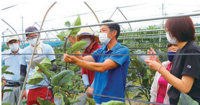
講師の説明に聞き入る参加者ら

J Aしもつけナス部会は7月6日、都賀地区で第3回夏秋ナス新規栽培者講習会を開きました。今後の予定者を含む新規栽培者、部会役員、県職員、J A職員ら13人が参加。4月に始まった一連の講習会も今回で最終回を迎えました。講習の締めくくりは、枝切りと葉かきについて作業手順を学びました。